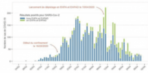
Nombre de résultats biologiques positifs pour SARS-CoV-2 diagnostiqués par jour en Nouvelle-Aquitaine au 30 avril 2020 (N = 4672)