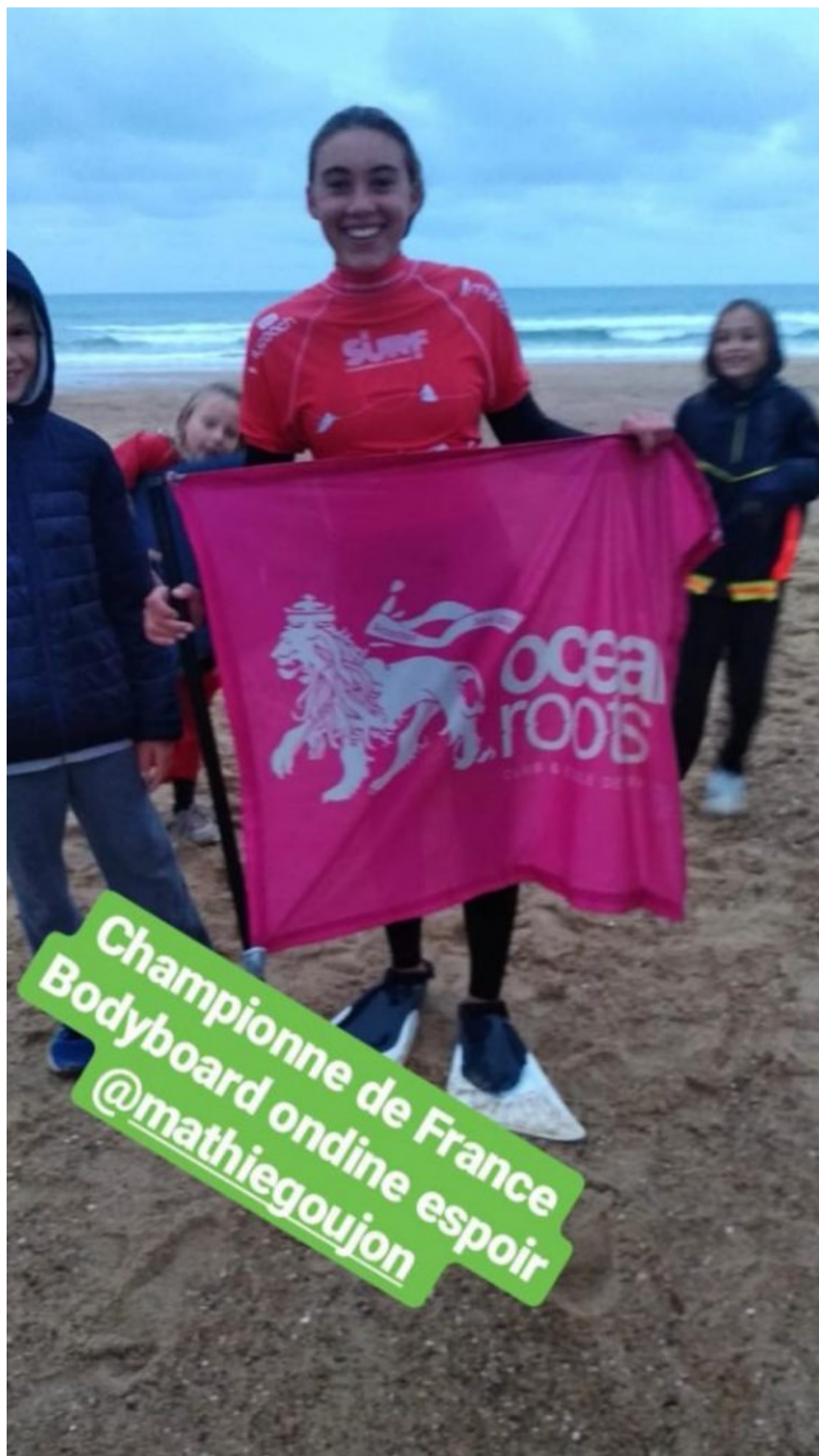
Championne de France Bodyboard ondine espoir @mathiegoujon